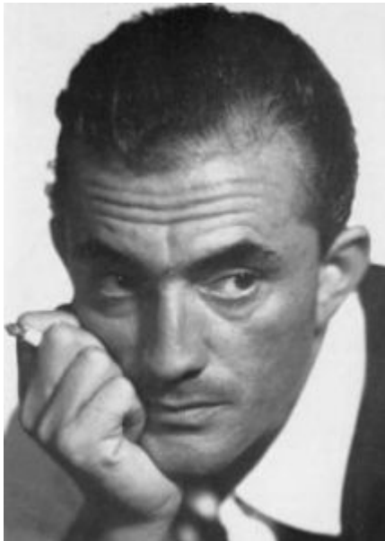
Luchino Visconti di Modrone

https://upload.wikimedia.org/wikipedia/commons/6/69/Luchino_Visconti_5.jpg