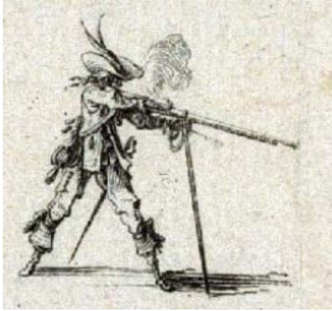
dettaglio da J. Callot, L'exercice de l'arquebuse (1635)